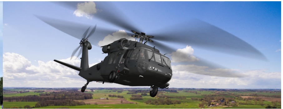
Air Assault demonstratie (Black Hawk helicopters) van 14.30 – 16.00 uur