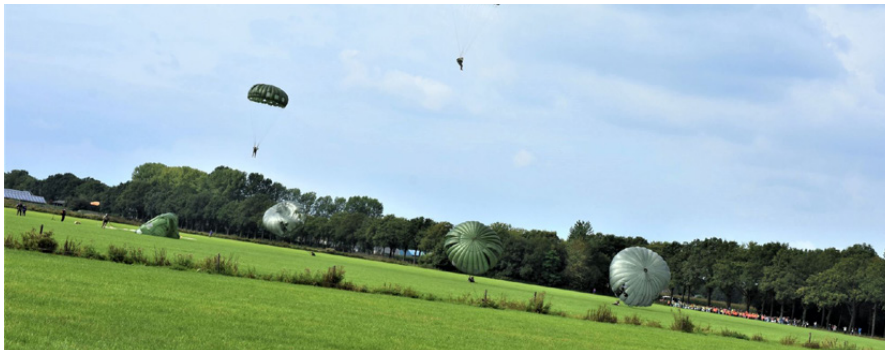
Airborne demonstratie (herdenkingsprongen) van 11.00 – 14.00 uur

Absolute hoogtepunten bij het vieren en herdenken van 80 jaar vrijheid zijn de Airborne en Air Assault Demonstratie op de Vlagheide. U heeft nu de kans om hier gratis bij aanwezig te zijn op dinsdag 17 september!