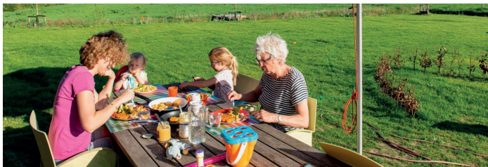
Wonen in Veghels Buiten

Kijk voor meer informatie over de nieuwe kavels en andere te koop staande kavels op www.veghelsbuiten.nl